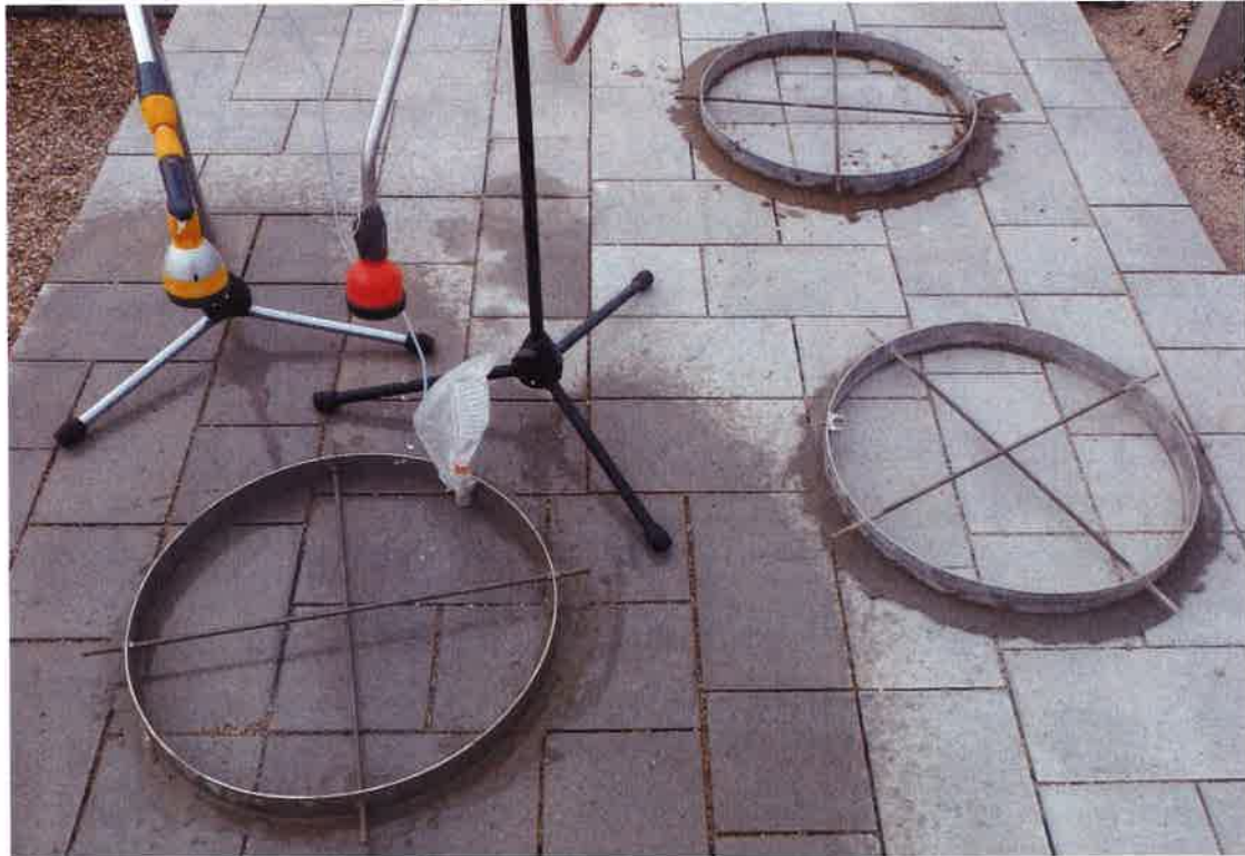
Bild: Retro XL, wilder Verband, 2 Formate